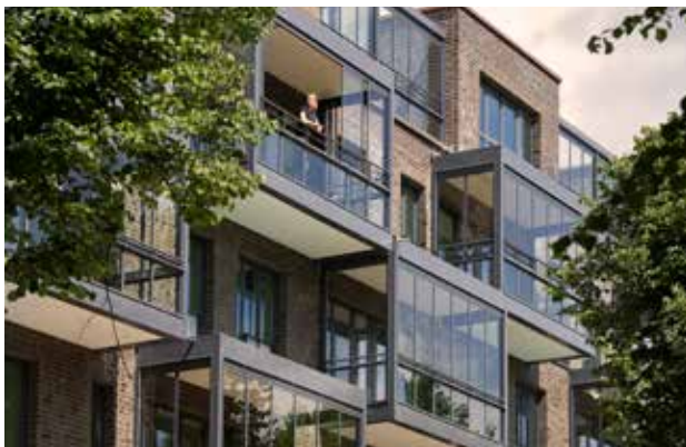
Ohne Wind und Zugluft den Balkon perfekt nutzen

Mit Schiebe-Dreh- oder Schiebesystemen aus Glas schützen Sie sich auf Ihrem Balkon nicht nur vor rauen Witterungsverhältnissen wie Wind, Regen und Kälte, sondern auch vor Lärm. Je nach Anforderung sind komplett transparente oder gerahmte Systeme erhältlich. Die flexiblen, ungedämmten Verglasungen verwandeln Ihren Balkon auf Wunsch in einen luftigen Freisitz oder einen wettergeschützten Raum. Die verschiedenen Systemlösungen können auch nachträglich auf vorhandene Brüstungen montiert werden.