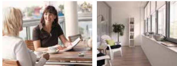
Mit einer Verglasung wird der Balkon zum Lieblingsort