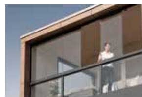
Für jede Anforderung das passende System